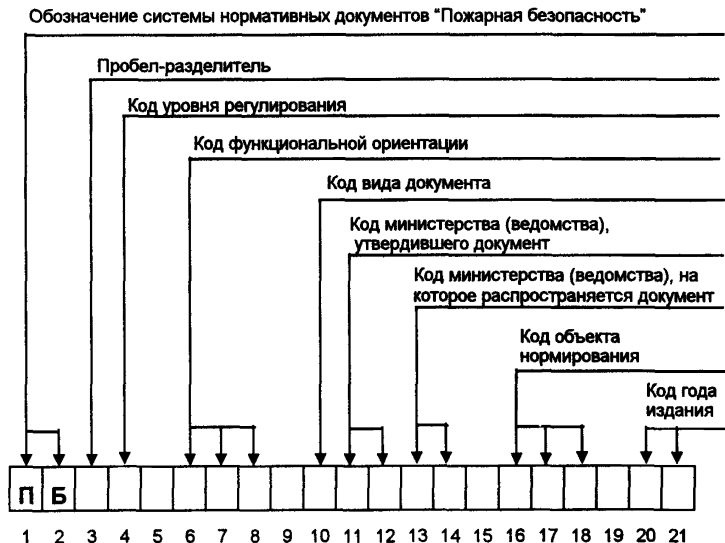
Рис. 1. Структура кодов нормативных документов по пожарной безопасности

1.2. Каждый класс (подкласс) обозначают цифровым кодом. Совокупность кодов, записанная в определенной последовательности, образует код нормативного документа (рис.1).