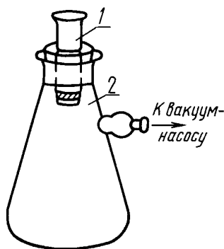
1 — тигель или воронка стеклянные фильтрующие; 2 — колба для фильтрования под вакуумом