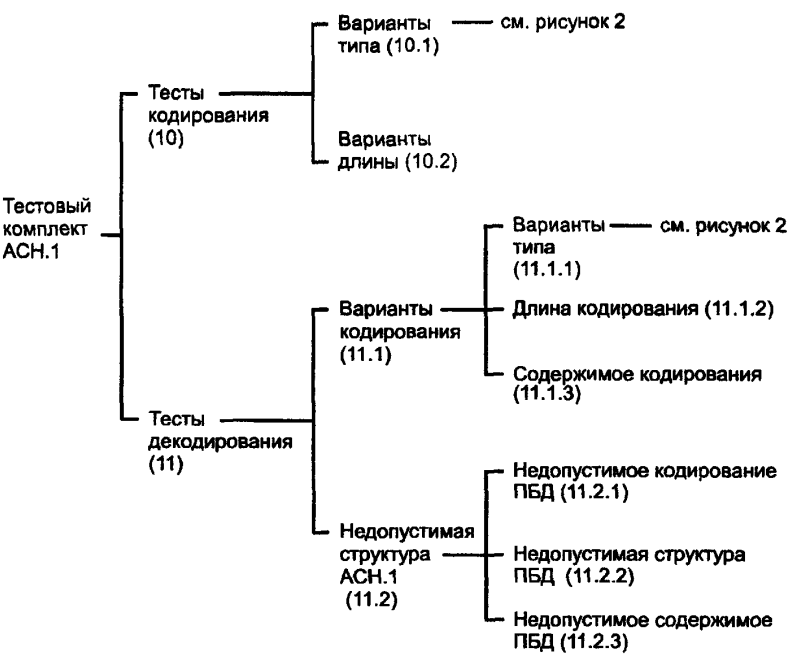
Рисунок 1 — Структура тестового комплекта АСН.1

Каждая из этих групп подразделена на ряд тестовых групп более низкого уровня. Полная структура большинства тестовых групп дана на рисунках 1 и 2.