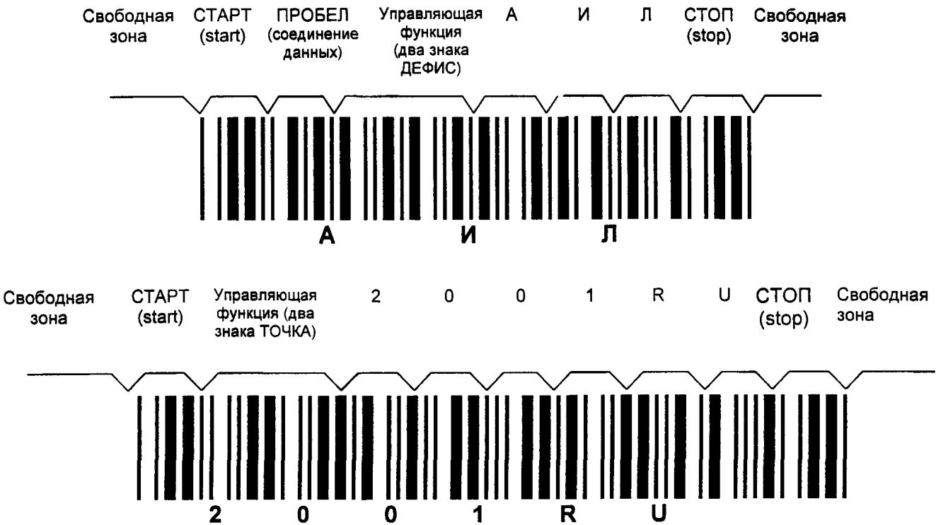
Рисунок Е.2 — Символы штрихового кода, в которых закодированы данные АИЛ2001RU