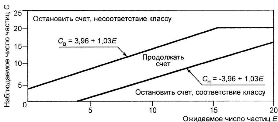
Рисунок F.1 — Границы соответствия и несоответствия классам чистоты при использовании метода последовательного отбора проб

На рисунке F.1 по оси абсцисс отложены значения ожидаемого числа частиц E , если концентрация частиц равна максимально допустимому значению для заданных размеров частиц и класса чистоты (В.4.2). По оси ординат отложены значения наблюдаемого числа частиц C в пробе.