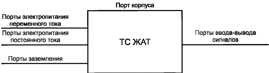
Рисунок 1 — Примеры портов ТС ЖАТ

- порт — граница между ТС ЖАТ и внешней электромагнитной средой (зажим, разъем, клемма, стык связи и т.д. (рисунок 1);