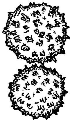
Рисунок 2 — Пыльцевые зерна хлопчатника (Gossypium hirsutum L.)