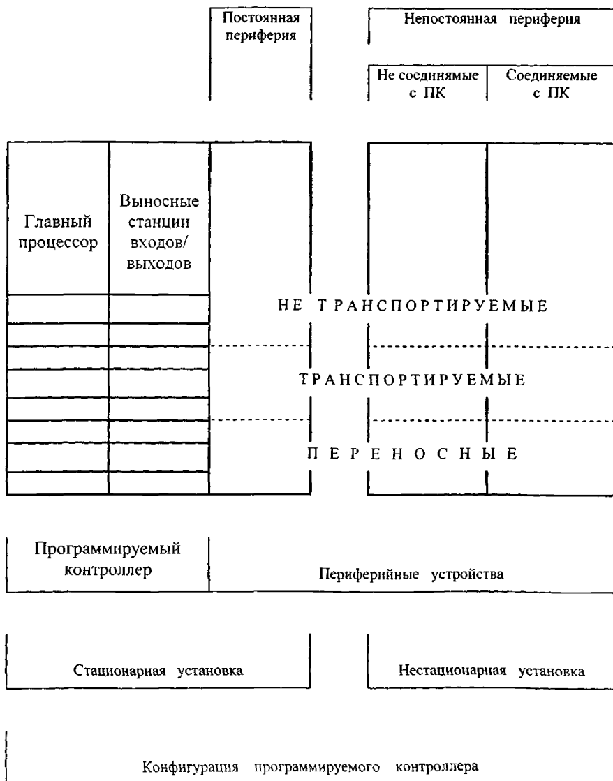
Рис. А.2. Базовая аппаратная структура конфигурации ПК