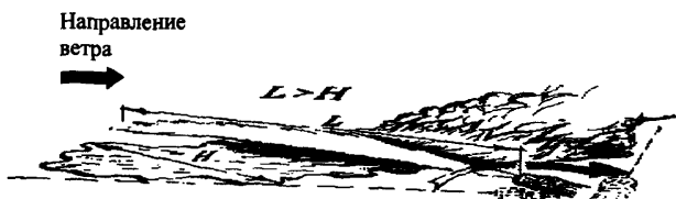
Рис. 3. Схема применения устройства для тушения проливов ЛВЖ способом “срезания” пламени

Нужно также учитывать высокую скорость подачи ОТВ. Управление стволом должно быть плавным, чтобы не разбрызгивать горючую жидкость и не допустить проскока пламени. При тушении ЛВЖ с близких расстояний в первый момент подачи ОТВ нужно быть готовым к импульсивному выбросу тепла из очага горения.