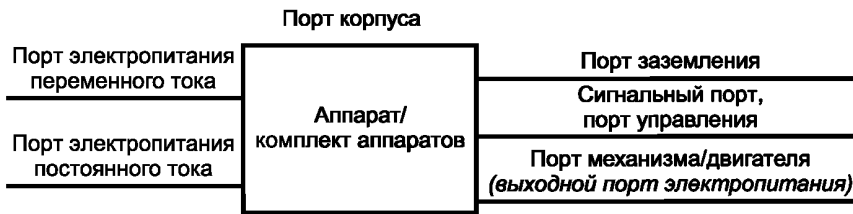
Рисунок 3 — Примеры портов аппарата/комплекта аппаратов

4.3 Если невозможно оценить уровни устойчивости к электромагнитным помехам при выполнении аппаратом/комплексом аппаратов каждой функции, следует выбирать наиболее критичный период работы, при котором обеспечивается наименьшая устойчивость к помехе конкретного вида.