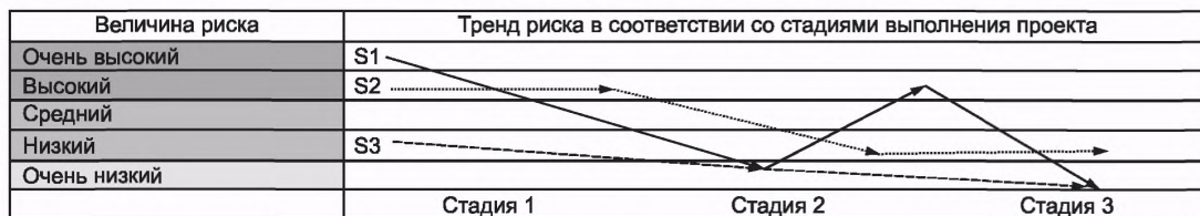
Рисунок 7 — Пример изображения тренда риска