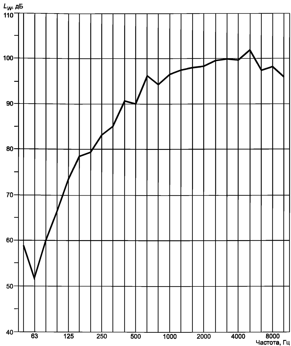
Рисунок В.1 — Спектр уровней звуковой мощности искусственного источника шума, соответствующего приложению А (Спектр определен измерениями по ГОСТ 31274.)

П р и м е ч а н и е — Корректированный по А уровень звуковой мощности L_{WA} = 110 дБА.