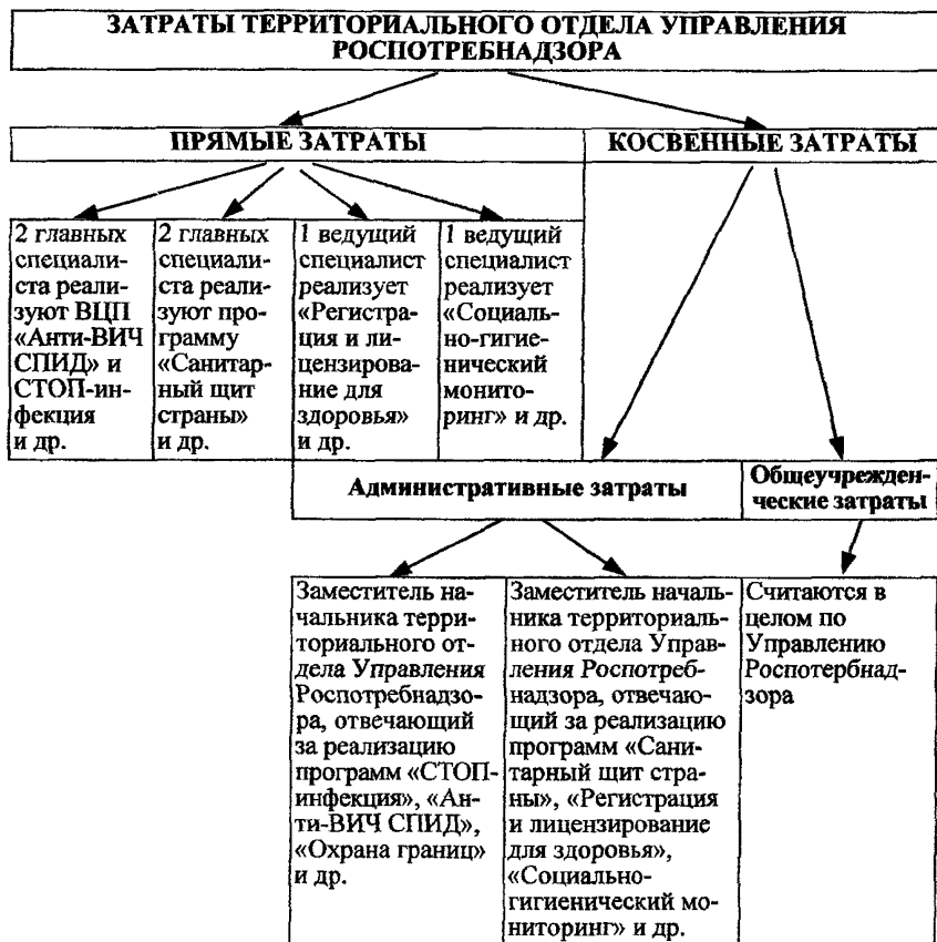
Рис. 3. Примерная схема распределения затрат некоторых ВЦП в территориальном отделе Управления Роспотребнадзора