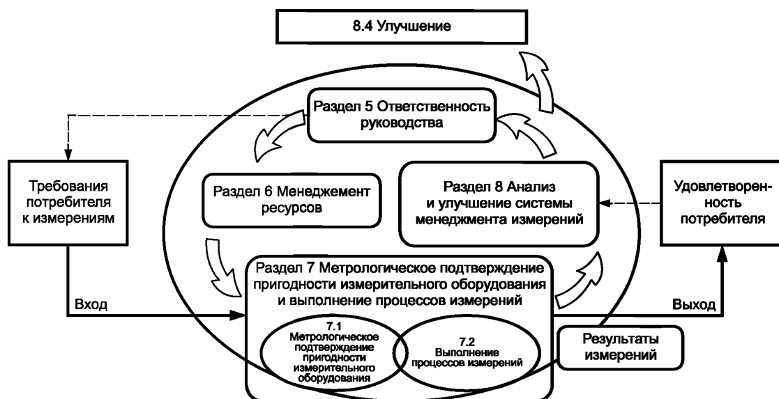
Рисунок 1 — Модель системы менеджмента измерений

Одним из установленных принципов менеджмента качества в ИСО серии 9000 является процессный подход. В системе менеджмента измерений процессы измерений следует рассматривать как специальные процессы, направленные на обеспечение требуемого качества продукции, выпускаемой организацией. Модель системы менеджмента измерений, соответствующая настоящему стандарту, представлена на рисунке 1.