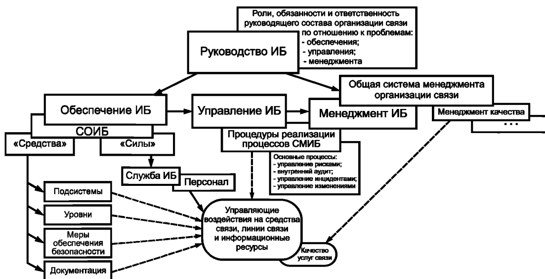
Рисунок 1 — Взаимосвязь процессов руководства, менеджмента, управления и обеспечения

Мероприятия и действия, реализующие процесс управления, должны быть коррелированы с действиями, выполняемыми при менеджменте ИБ, и не должны повторять друг друга.