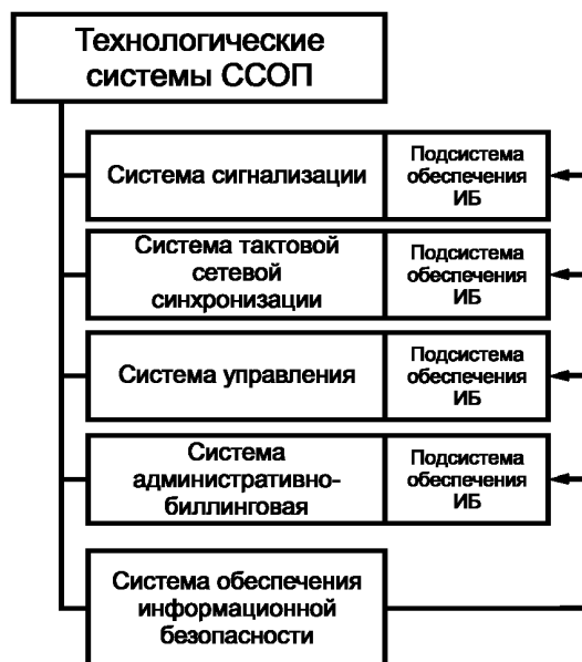
Рисунок 4 — Взаимосвязь СОИБ с технологическими системами ССОП

11.3 Одной из задач СОИБ является обеспечение безопасности технологических систем и, прежде всего, системы управления сетью (сетями) электросвязи, для чего СОИБ должна: