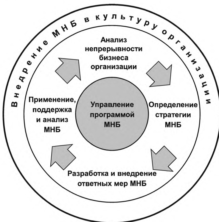
Рисунок 1 — Этапы жизненного цикла менеджмента непрерывности бизнеса

Жизненный цикл МНБ включает шесть элементов (см. рисунок 1). Элементы жизненного цикла могут быть внедрены организациями различных размеров и секторов экономики: государственными, частными, некоммерческими, образовательными, производственными и т.д. Область применения и структура программы МНБ могут быть различны. Затраченные на внедрение МНБ усилия зависят от индивидуальных потребностей организации, однако в любом случае эти шесть существенных элементов должны быть выполнены.