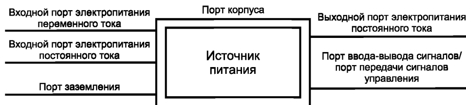
Рисунок 1 — Примеры портов источника питания

Примечание — Примеры портов см. на рисунке 1.