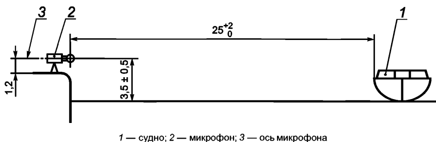
Рисунок 2 — Положение микрофона

9.1.3 Расстояние от микрофона до обращенного к нему борта судна должно быть 25^{+2}_0 м. Контроль расстояния производят при каждом проходе судна.