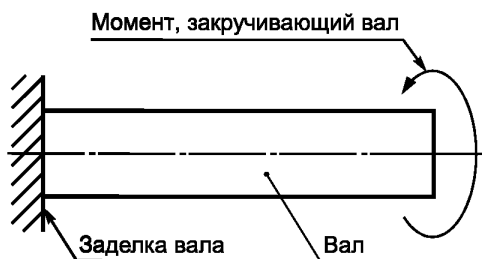
Рисунок 1 — Схема испытаний валов на прочность

Изделия считают прошедшими испытания на прочность, если после испытаний не обнаружено остаточной деформации узлов или деталей.