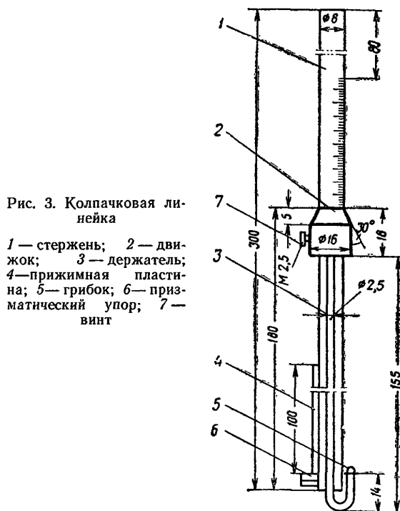
Рис. 3. Колпачковая линейка

отклонение верхних кромок сливных труб или перегородок от поверхности тарелки — 2 мм;