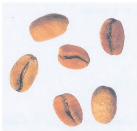
Рисунок С.13 — Коричневое зерно («ardido») (см. 4.3)