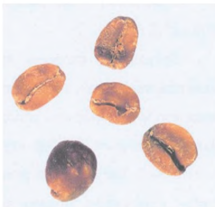
Рисунок С.16 — Восковидное зерно (см. 4.6)