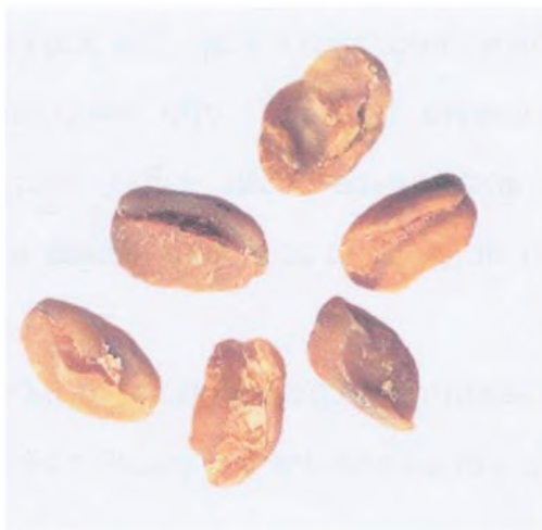
Рисунок С.5 — Зерно неправильной формы: вмятины (см. 3.1)