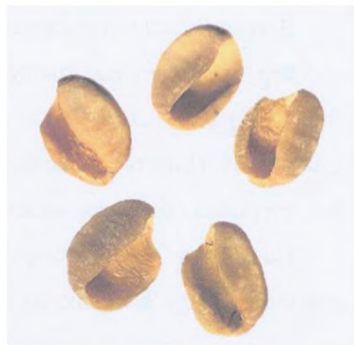
Рисунок С.6 — Зерно неправильной формы: раковины (см. 3.1)