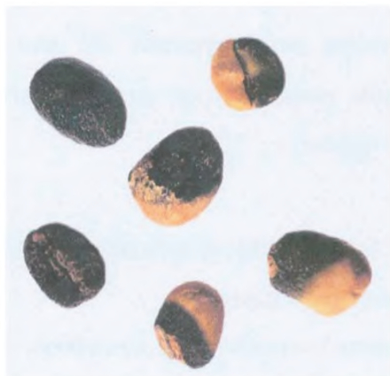
Рисунок С.11 — Черное зерно и частично черное зерно (см. 4.1)