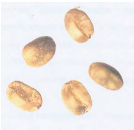
Рисунок С.17 — Пятнистое зерно (см. 4.7)