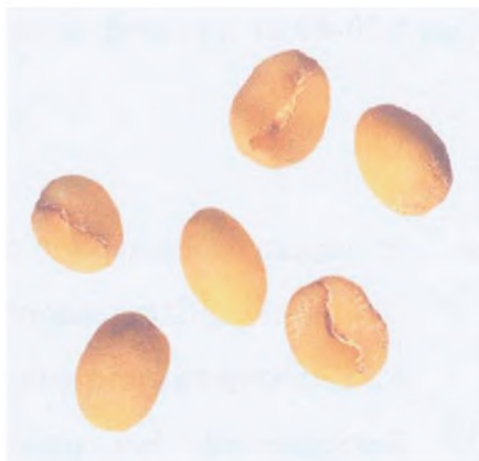
Рисунок С.14 — Янтарное зерно (см. 4.4)