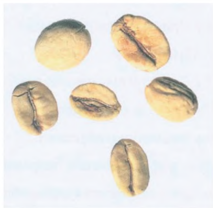
Рисунок С.20 — Белое зерно (см. 4.10)