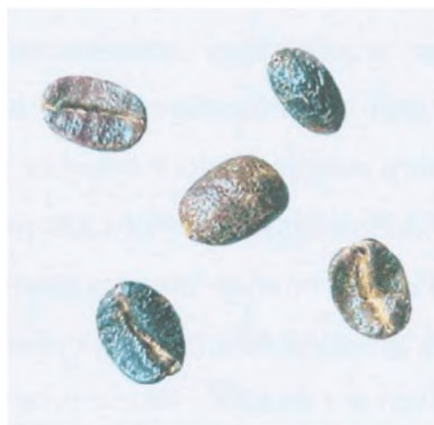
Рисунок С.12 — Черно-зеленое зерно (см. 4.2)