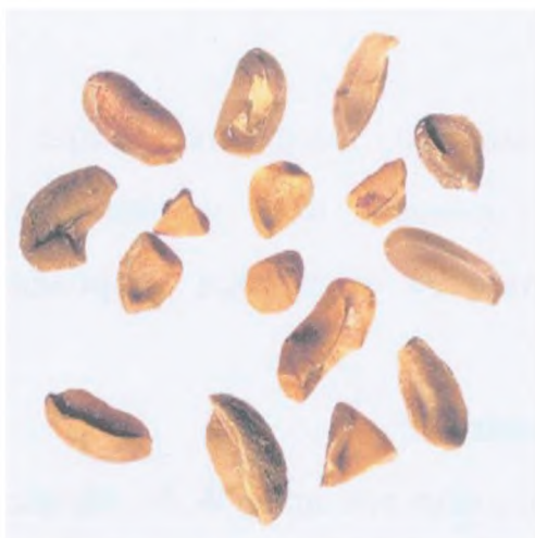
Рисунок С.7 — Обломки зерна (см. 3.2)