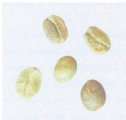
Рисунок С.15 — Незрелое зерно; неразвившееся зерно («quaker») (см. 4.5)