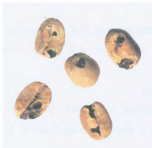
Рисунок С.9 — Зерно, поврежденное насекомыми (см. 3.4)