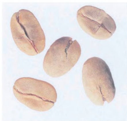
Рисунок С.1 — Зерно в пергаментной оболочке (см. 2.1)