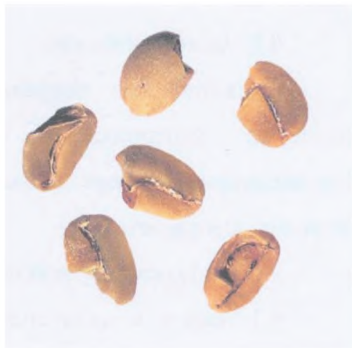
Рисунок С.8 — Ломаное зерно (см. 3.3)