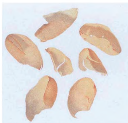
Рисунок С.2 — Часть пергаментной оболочки (см. 2.2)