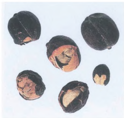
Рисунок С.3 — Сухой кофейный плод (см. 2.3)