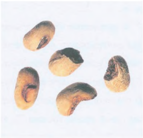
Рисунок С.10 — Зерно, поврежденное при пульпировании (см. 3.6)