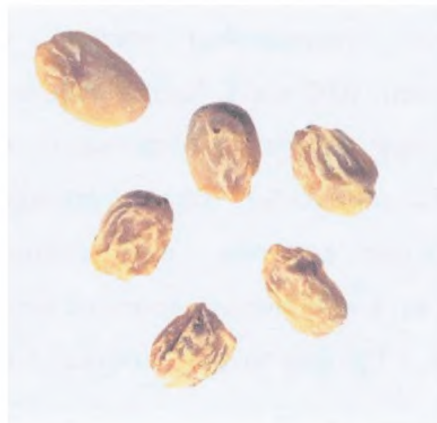
Рисунок С.18 — Сморщенное зерно (см. 4.8)