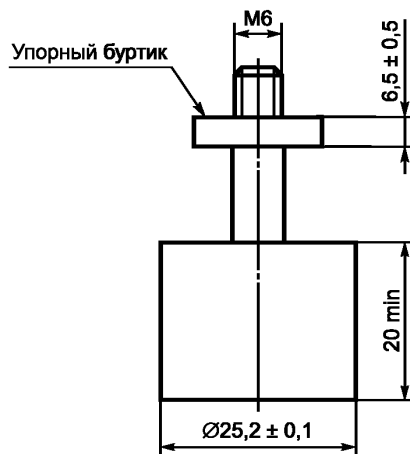
Рисунок 3 — Испытательный штамп площадью основания 500 мм 2