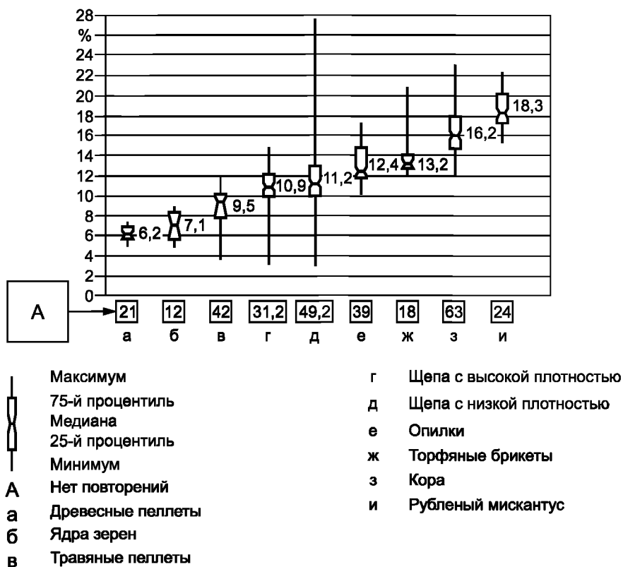
Рисунок А.1 — Относительное отклонение неударного применения

Относительное приращение определений насыпной плотности для твердого биотоплива. Применение метода с ударным воздействием в сравнении с безударным воздействием