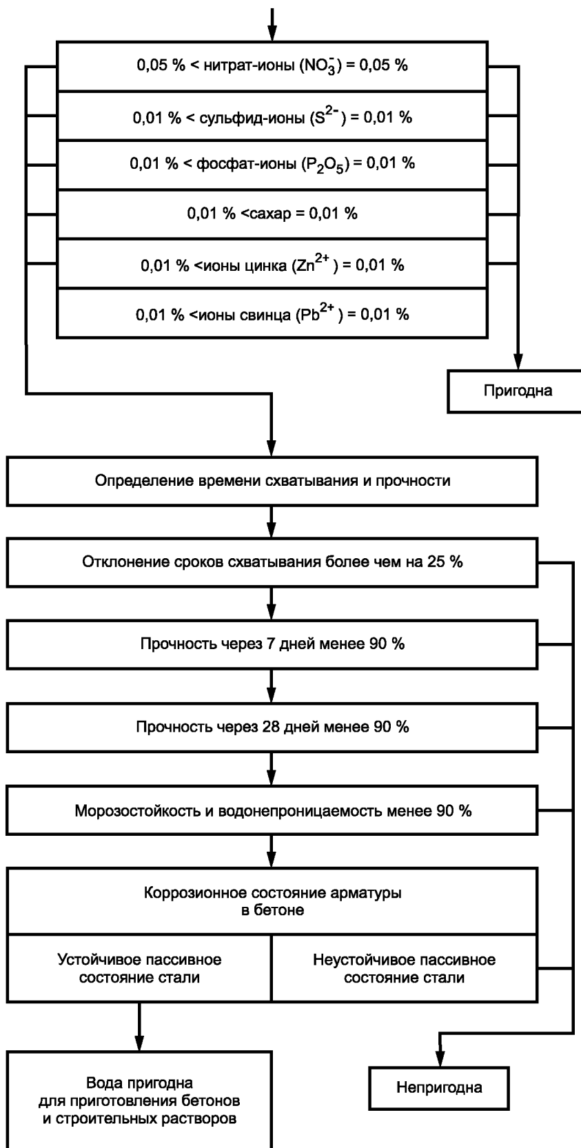
Рисунок А.1 (лист 2)