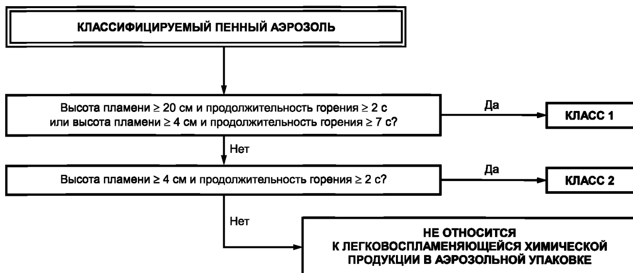
Рисунок 2 — Процедура классификации опасности химической продукции, являющейся пенным аэрозолем