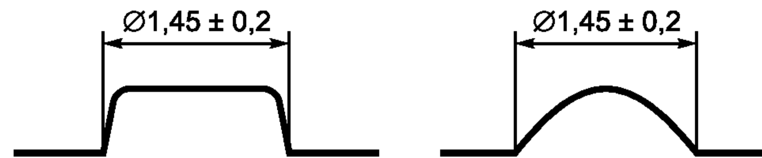
Рисунок 3 — Примеры формы и размер основания точек ТИ

Точки, используемые для изображения ТИ, должны иметь рельефную высоту 0,48 мм максимум и 0,3 мм минимум над прилегающей поверхностью карты. Настоящий стандарт не регламентирует форму каждой точки. На рисунке 3 приведены примеры формы точек ТИ и указан размер их основания.