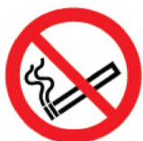
ИСО 7010-P002 Не курить! (запрещение)