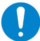
ИСО 7010-M001 Общий знак обязательного действия