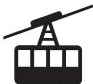
ИСО 7001-0033 Канатная подвесная дорога с большими кабинами (информация для публики)