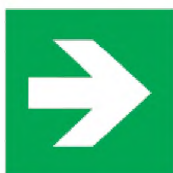
ИСО 7010-E005 Стрелка, указывающая направление (условие безопасности)