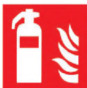
ИСО 7010-F001 Огнетушитель (пожарная безопасность)