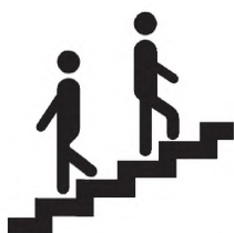
ИСО 7001-0011 Лестница (информация для публики)