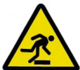
ИСО 7010-W007 Предупреждение, препятствия (предупреждение)