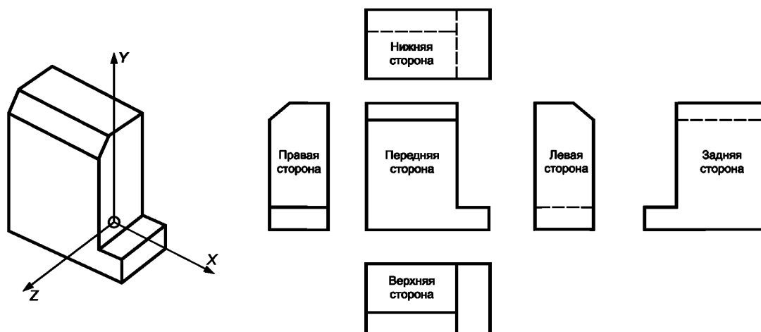
Рисунок 1 — Значение управляющей переменной представления стороны

Значение управляющей переменной представления стороны и ее связи с объектом geometric_representation_context библиотечной детали представлены на рисунке 1, на котором показано, как можно определить сторону в соответствии с базовой системой координат детали. В случае трехмерной геометрии и при негеометрических представлениях значение стороны должно быть равно 0 ('null').