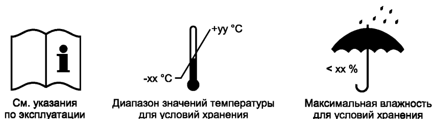
Рисунок 2 — Пиктограммы