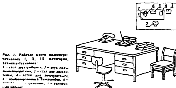
Рис. 1. Рабочее место инженер-технолога I, II, III категории, техника-технолога: 1 - стол двухтумбовый, 2 - стул подъемно-поворотный, 3 - стул для посетителя, 4 - лотки для документации, 5 - комбинированный канцприбор, 6 - телефонный справочник, 7 - телефонный аппарат