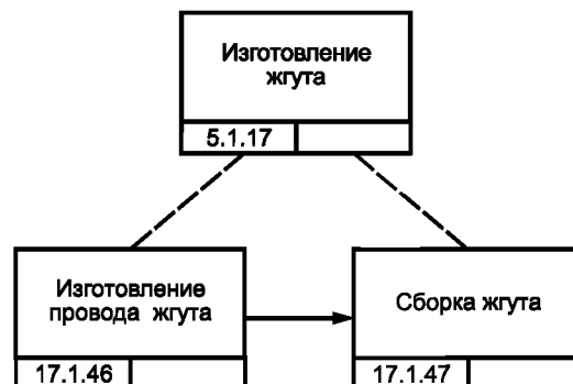
Рисунок В.4 — Блок-схема процесса изготовления жгутов для изделия GT-350 [8]

Жгуты изделия GT-350 изготавливают в виде под сборки двигателя этого изделия, что предусматривает работы кабельной мастерской (см. рисунок В.4). Рисунок В.5 более подробно иллюстрирует процесс изготовления жгута, сборку которого выполняет монтажник в кабельной мастерской, что занимает у него 10 мин на один комплект.