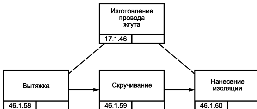
Рисунок В.5 — Блок-схема процесса изготовления жгута проводки [8]

Процесс assemble_harness требует привлечения одного ресурса — жгута. Поскольку этот ресурс используется в этом процессе и не расходуется, то объем ресурса (определенный функцией resource_point ) не изменяется при любом элементе процесса assemble_harness .