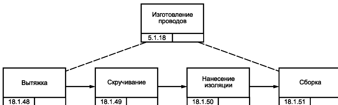
Рисунок В.6 — Блок-схема процесса изготовления проводов для изделия GT-350 [8]

Комплект жгутов проводки для изделия GT-350 изготавливают в виде под сборки двигателя этого изделия, что предусматривает работы кабельной мастерской.