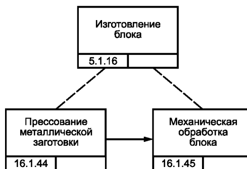
Рисунок В.3 — Блок-схема процесса изготовления блока цилиндров изделия GT-350 [10]

Блок цилиндров изделия GT-350 изготавливают в виде под сборки двигателя этого изделия, что предусматривает работы литейного производства и цеха механообработки (см. рисунок В.3).