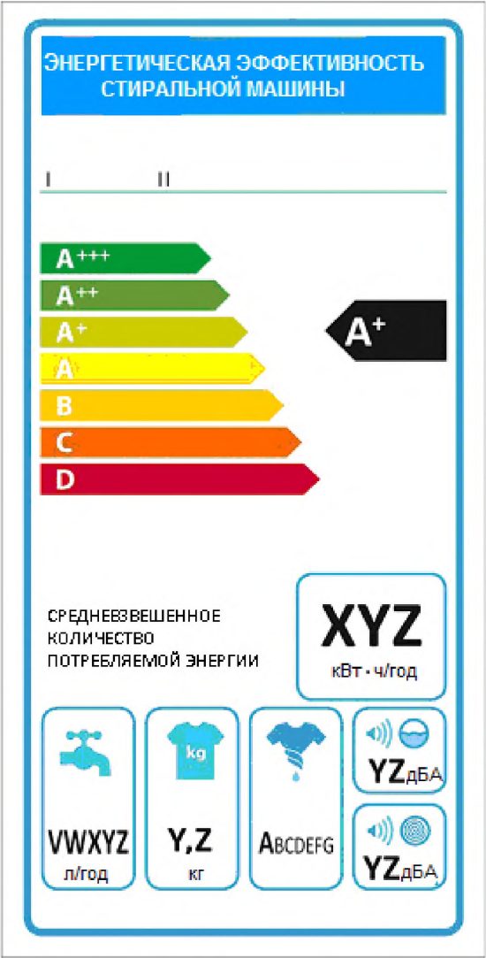
Рисунок А.1– Вид этикетки энергетической эффективности стиральных машин