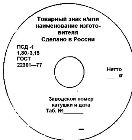
Рисунок А.2 — Расположение маркировки на ярлыке, прикрепленном к катушке

Для поставки на внутренний и рынки стран СНГ рынок