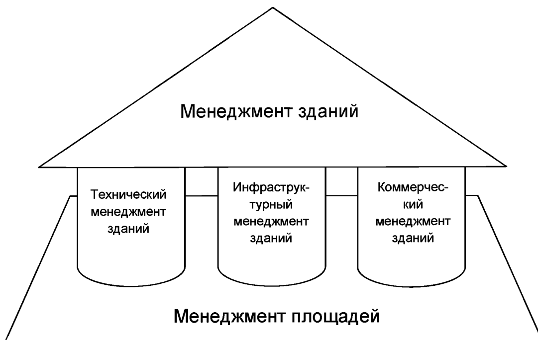
Рисунок 1 — Области оказания услуг менеджменту зданий