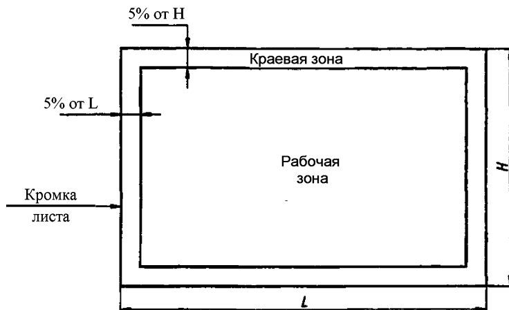
Рисунок 2 – Осматриваемые зоны стекла с покрытием конечного размера

Краевая зона составляет 5 % от длины (L) и 5 % от ширины (H) листа стекла.