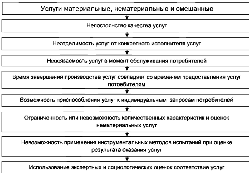
Рисунок 2 — Специфические особенности услуг

Поэтому при разработке и внедрении системы менеджмента качества в организациях, предоставляющих услуги населению, необходимо учитывать особенности сферы услуг.