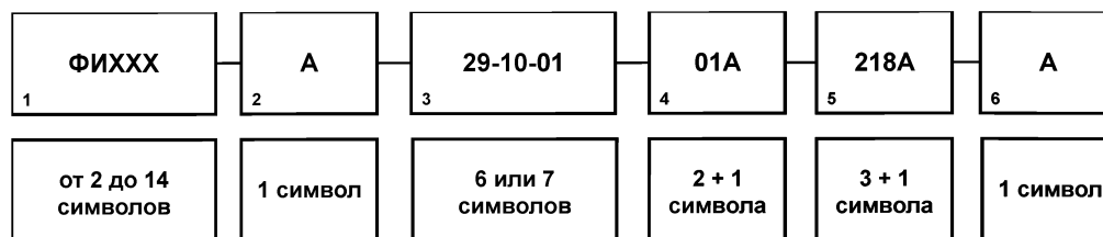
Рисунок А.1 — Структура ОМД

А.3.1 ОМД состоит из структурированного набора элементов, каждый из которых представляется одним или несколькими алфавитно-цифровыми символами (рис. 1).