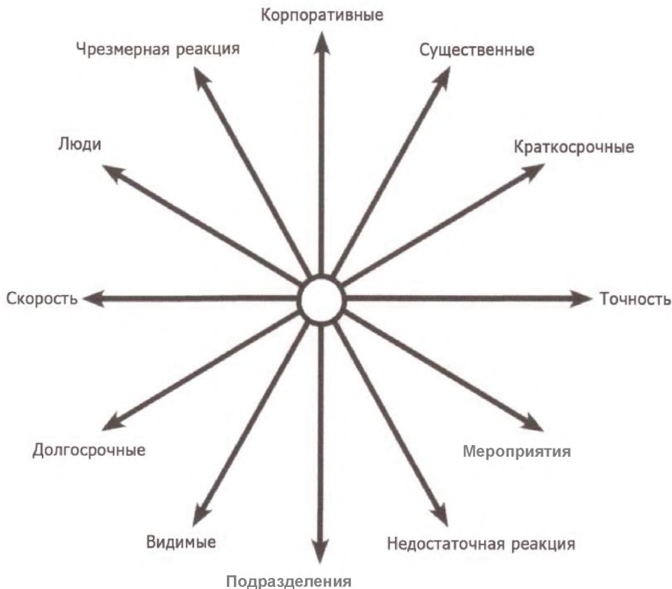
Рисунок 2 – Стратегические дилеммы в принятии решений

Например, могут быть важные дела, о которых знает менеджмент в условиях кризиса и которые должны быть выполнены (существенные, но менее заметные для СМИ или причастных сторон), но это может конфликтовать с необходимостью выполнить другие действия для демонстрации общего контроля, авторитета и укрепления доверия (что, возможно, менее важно, но более заметно). Точно так же курс действий с долгосрочной пользой может конфликтовать с курсом ожиданий общественности или сотрудников результатов в короткое время, что свидетельствовало бы о быстром решении.