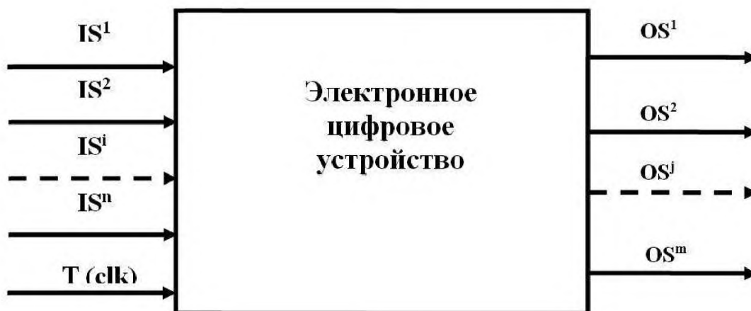
Рисунок 1 – Физическое представление устройства

6.1.4 Работа устройства тактируется одним из входных сигналов либо от одного внутреннего генератора, входящего в состав устройства. На входные контакты краевых разъемов могут подаваться входные цифровые тестовые воздействия, а с выходных контактов этих разъемов может быть снята реакция (выходные цифровые сигналы) устройства на входные воздействия. Сопоставление полученных реакций с эталонными позволяет сделать вывод о работоспособности ОК и осуществлять диагностику обнаруженных неисправностей. Совокупность входных воздействий и соответствующие им эталонные реакции ОК представляют собой тест.