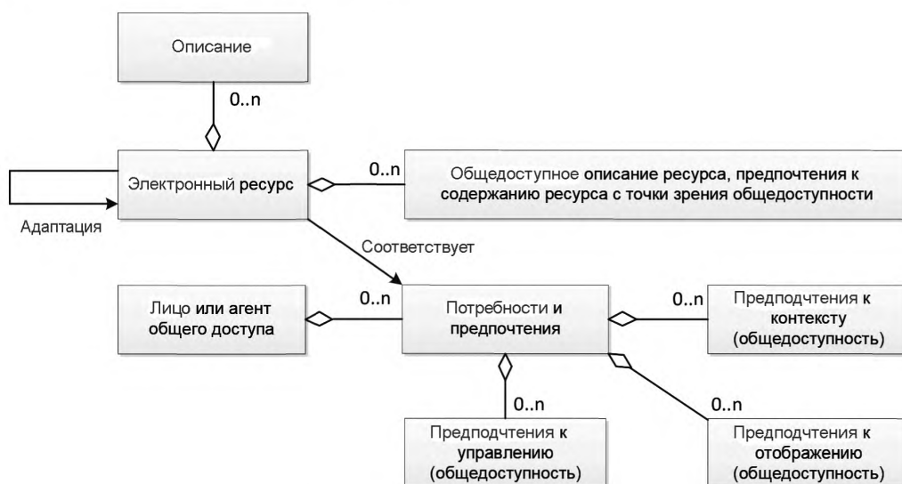
Рисунок 2 — Абстрактная модель общедоступности

Абстрактная модель для последующих частей настоящего стандарта (типов А и Б) представлена в виде диаграммы классов UML на рисунке 2.