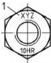
1 — маркировка товарного знака изготовителя болтокомплекта