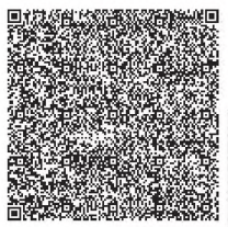
Рисунок 5 — Пример изображения двумерного символа штрихового кода с графическим маркером стандарта

Пример изображения двумерного символа штрихового кода с графическим маркером стандарта приведен на рисунке 5.