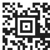
Рисунок 2 — Символ Aztec Code

Пример символа Aztec Code приведен на рисунке 2.