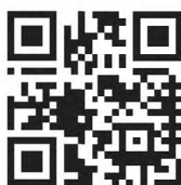
Рисунок 1 — Символ QR Code

Пример символа QR Code приведен на рисунке 1.