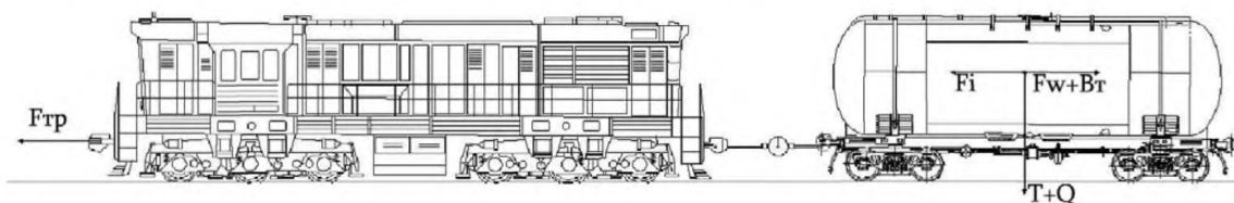
Рисунок 1 – Схема установки динамометра

Схема установки динамометра представлена на рисунке 1.