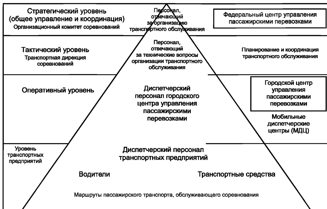
Рисунок 1 — Иерархические уровни ситуационного управления процессами транспортного обслуживания зрителей массовых спортивных мероприятий

4.3 Тактический уровень управления реализуется специально создаваемой организацией — транспортной дирекцией соревнований, на которую возлагаются технические вопросы планирования, организации и координации транспортного обслуживания, включая: