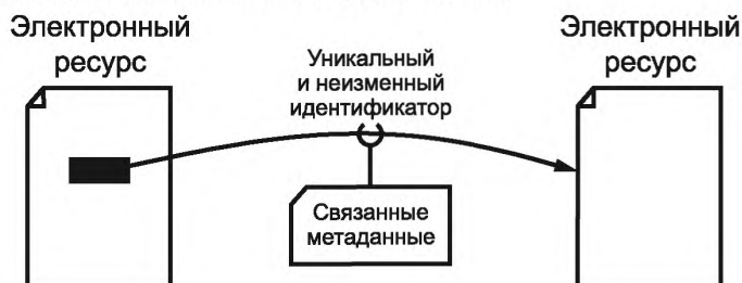
Рисунок 1 — Использование уникальных PID для указания пути от исходного ресурса к целевому