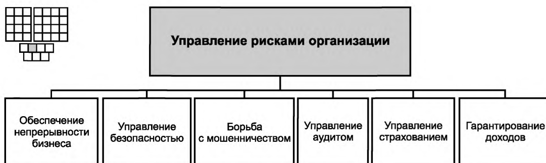
Рисунок 3 — Декомпозиция группы процессов «Управление рисками организации» на элементы процессов уровня 2

6.2 Процессы группы 1.3.2 предназначены для выявления рисков и угроз потери доходов или репутации организации, кроме того они должны обеспечивать минимизацию или устранение влияния выявленных рисков. Обнаружение рисков должно осуществляться как для физических, так и для логических/виртуальных рисков.