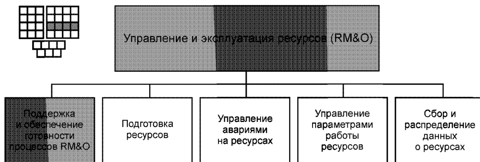
Рисунок 1 — Декомпозиция группы процессов RM&amp;O на элементы процессов уровня 2