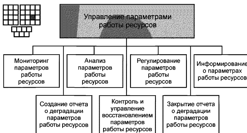
Рисунок 3 — Декомпозиция процесса 1.1.3.4 — «Управление параметрами работы ресурсов» на элементы процессов уровня 3

6.2 Процесс 1.1.3.4 и его элементы процессов уровня 3 предназначены для управления, контроля, мониторинга, анализа, информирования и регулирования значений параметров работы ресурсов на основе исходных данных, получаемых от процесса 1.1.3.5 «Сбор и распределение данных о ресурсах». Процессы 1.1.3.4 должны выявлять нарушения допустимых порогов параметров качества работы ресурсов и оценивать вероятность, в этих случаях, нарушения порогов для параметров качества оказания услуг. Информация о нарушениях порогов должна передаваться процессам 1.1.3.3 «Управление авариями на ресурсах» и процессам 1.1.2.4 «Управление качеством услуг» (см. ГОСТ Р 53633.4, (раздел 7)) для принятия решений по устранению проблем.