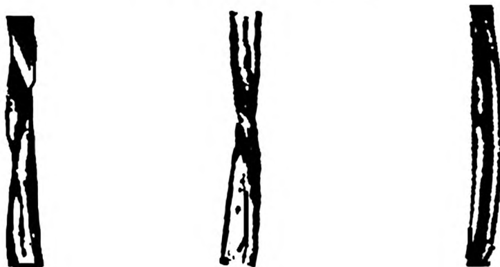
Рисунок Б.1 — Бактериально-грибковое заражение волокна отсутствует (I группа)