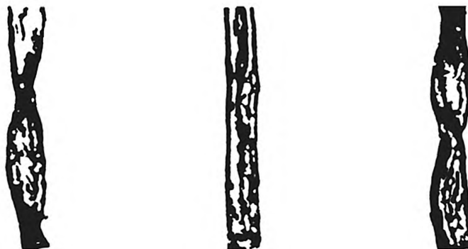
Рисунок Б.2 — Бактериально-грибковое заражение волокна слабой степени (II группа)