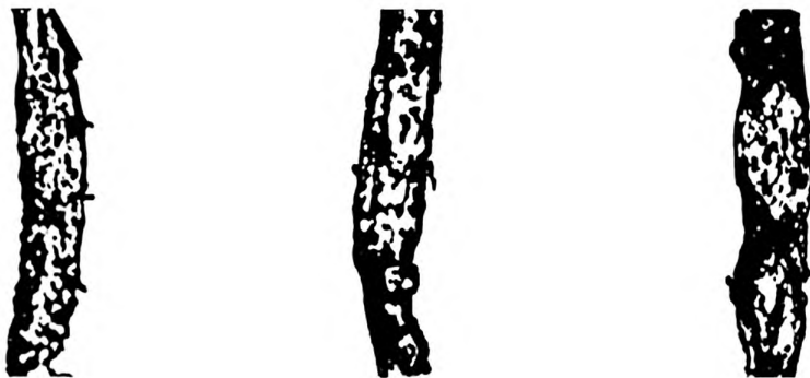
Рисунок Б.4 — Бактериально-грибковое заражение волокна сильной степени (IV группа)