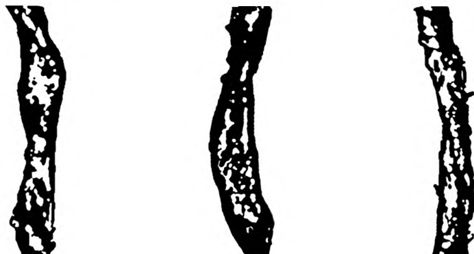
Рисунок Б.3 — Бактериально-грибковое заражение волокна средней степени (III группа)