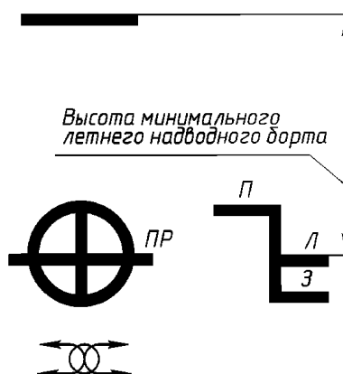
Рис. 3.1.4-2. Грузовая марка судов с минимальным надводным бортом